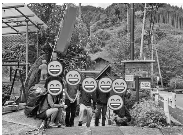
【図6】商品開発メンバーとの東京合宿の写真